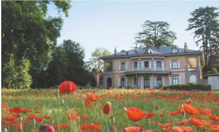
Ansicht des Gebäudes

präsentieren. Diese Präsentationsveranstaltung ermöglicht es uns auch, das 150-jährige Jubiläum des Impressionismus zu feiern, das sich 1874 mit der ersten Gemein-